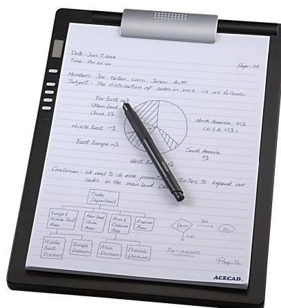
Figure 1 : Tablette électro-magnétique.

enregistrant l'écriture, sans dispositif supplémentaire (pas de stylo spécial), cf. Figure 1